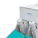
KIT OPCIONAL: 2 SUCTORES 2 suctores giratórios com acionamento automático.