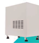
CAPA PROTETORA OPCIONAL